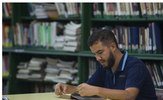
La Biblioteca Popular Sarmiento tiene más de 27.000 volúmenes

se dictan cursos de idiomas (inglés francés, italiano, portugués), ajedrez, guitarra, yoga, teatro para niños, jóvenes y adultos, talleres de plástica, talleres literarios, clases de gimnasia y funciona un coro de adultos. A su vez realizan actividades fomentistas y campañas solidarias como la recaudación de alimentos para inundaciones; donaciones de medicamentos a través de convenios con droguerías de la zona para las unidades sanitarias municipales y también reparten libros para nutrir a otras instituciones. Mensualmente reciben un promedio de ochocientos usuarios que consultan el material bibliográfico y poseen una colección de más de 27.000 libros.