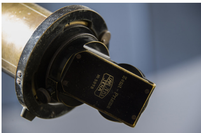
Detalle del telescopio CARL ZEISS construido en los años 20.