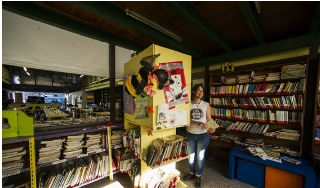
Sala de lectura y rincón infantil de la biblioteca popular.

calle Valentín Alsina 2777 en su antigua numeración (actualmente 3065). Allí estaban en un lugar también modesto pero no les impidió desarrollar las primeras conferencias y actos culturales bajo la presidencia de Marcelo Figuerola.