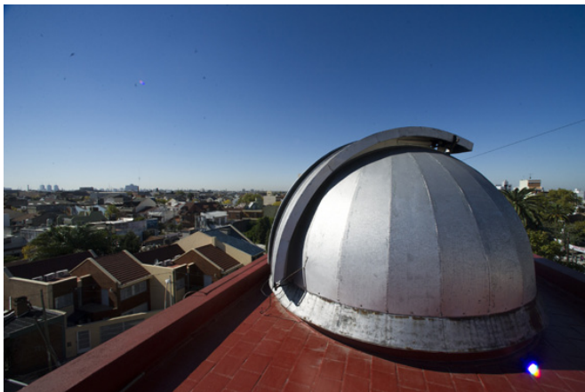
Cúpula del observatorio astronómico de la Biblioteca Popular Sarmiento de Valentín Alsina.