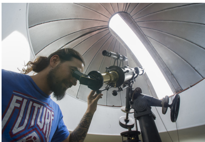
La biblioteca se estableció como un verdadero observatorio que en la actualidad nuclea a un grupo de entusiastas, bajo la supervisión de un profesor especializado.

telescopio personal con el que daba clases abiertas de astronomía en la plaza a pocos metros de la biblioteca. Al destapar la caja se encontró con una lente inmaculada y virginal, como si esa caja nunca hubiera sido abierta y hubiese atravesado los mares y el tiempo entre su construcción en 1928 y esa tarde de 1983. Tuvo que contener la emoción para que el chatarrero no percibiera en su semblante el deseo y la admiración que despertaba el cristal y que la demostración exagerada de su entusiasmo fuera contraproducente en la negociación.