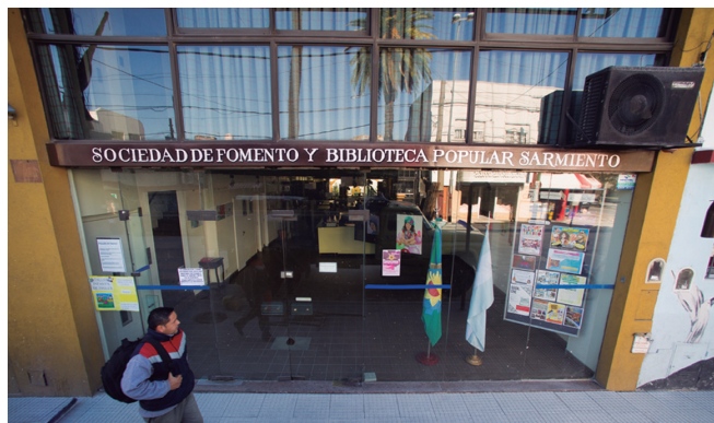
Fachada de la Biblioteca Popular Sarmiento.